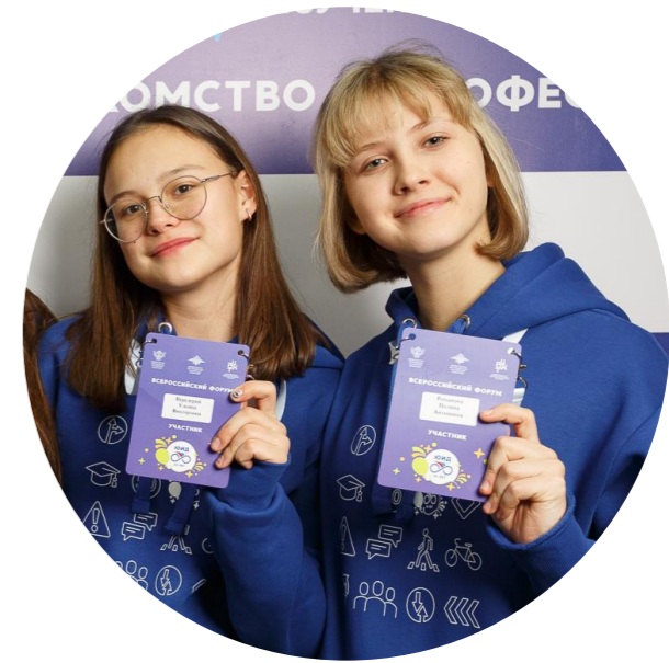
Старшие классы 15-17 лет