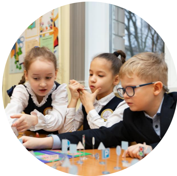
Дошкольники и младшие школьники, 5-9 лет

Активности разработаны с учетом особенностей восприятия информации каждой возрастной группой, что позволяет достичь наилучшего результата